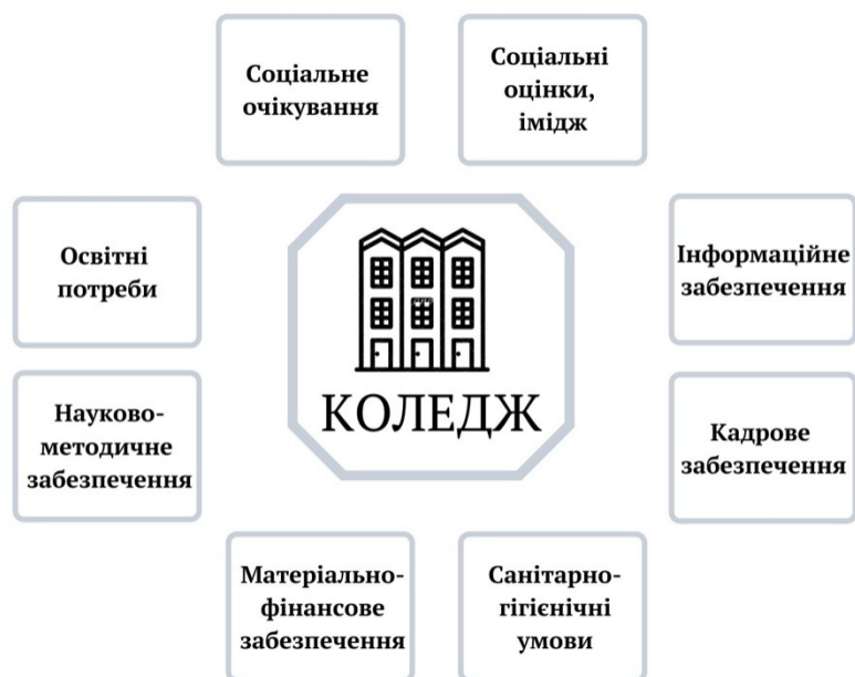
Рис. 1.4. Середовище як комплекс умов розвитку і функціонування коледжу