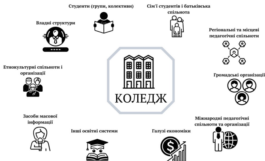
Рис. 1.3. Соціальне оточення коледжу

Аналіз цих двох моделей показує, що ефективність управління у значній мірі залежить від зовнішнього середовища коледжу, фактори впливу якого представлені на рис. 1.3.