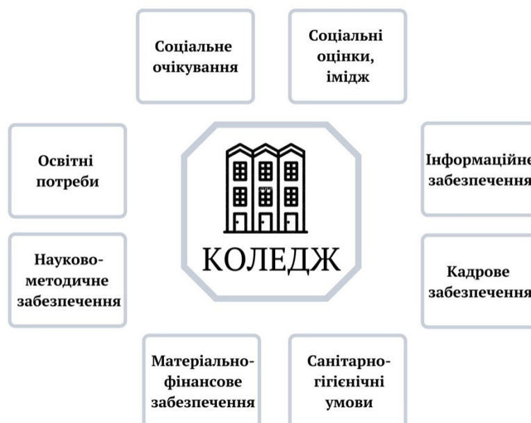
Рис. 1.4. Середовище як комплекс умов розвитку і функціонування коледжу

Отже, сучасний стан діяльності коледжу характеризується комплексом умов розвитку, представлених на рис. 1.4.